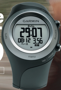
フォアアスリート405

高感度GPSトレーナーウォッチ ¥56,700(本体価格¥54,000) 品番:65870