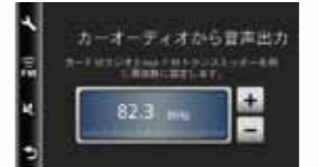
FMトランスミッター対応

MP3音楽ファイルと、WMVムービーファイルをサポートしていますので、ドライブ中のBGMや休憩中の映画鑑賞などで、あなたのドライブをより楽しく演出してくれます。