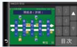
簡易図形表示 (レベル2)

文字 (1行15文字×2行) で交通情報を表示します。渋滞長さや規制内容を文字で確認する事が可能です。